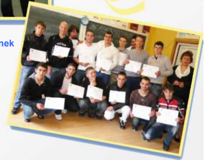
Az előzetes teszt eredményei: A magyarok, a románok, a finnek és a franciák – mind sikeresek voltak az értékelés során!